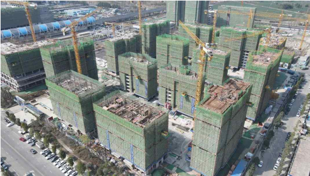
[그림] 한창 건설 중인 청두시의 TOD 보장성 임대주택 단지