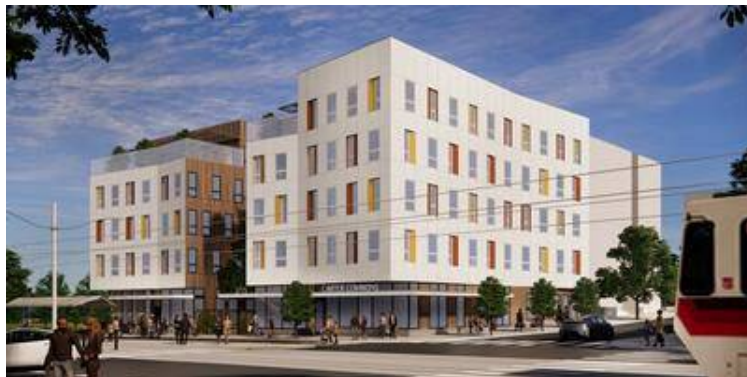
[그림 2] 신규 프로젝트2(M. Carter Commons)