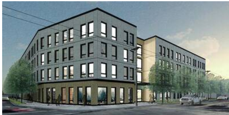
[그림 1] 신규 프로젝트1(Strong Family Property)