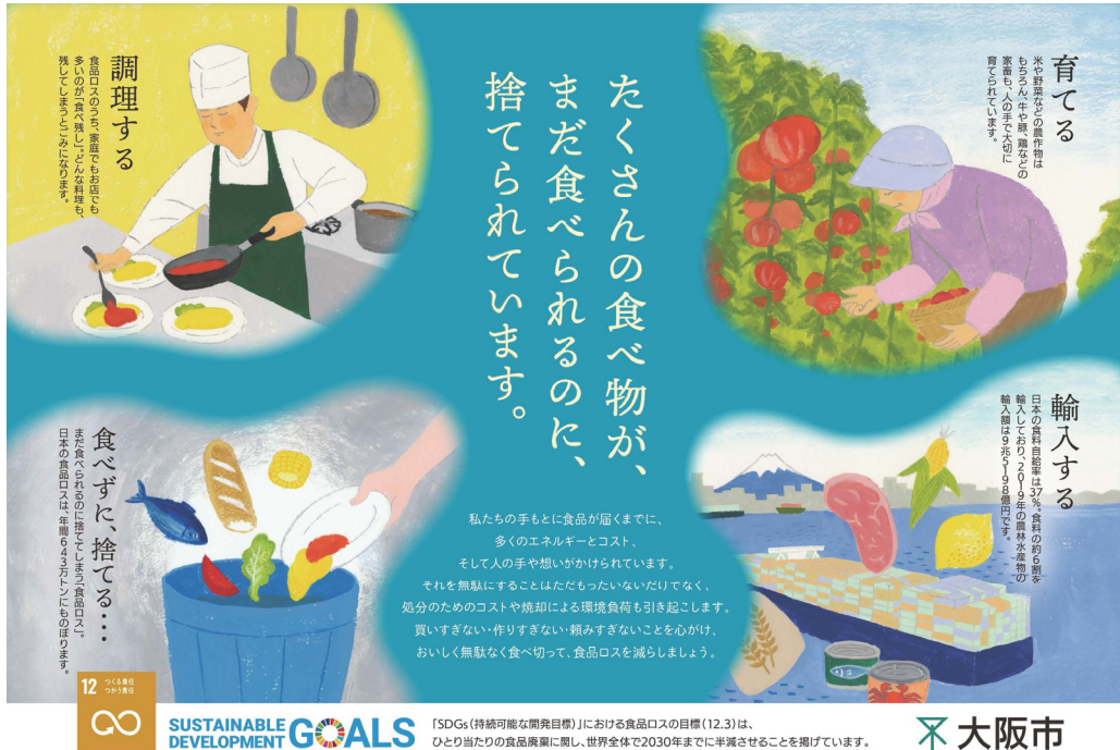
[그림 2] 오사카市の SDGs 포스터

https://www.city.osaka.lg.jp/kankyo/page/0000514966.html