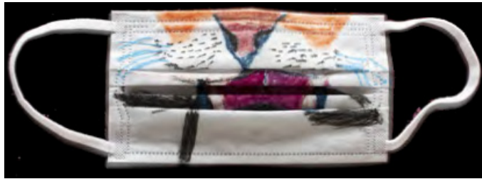
[사진 1] 교토市 동물원 모습을 담은 ‘아트마스크’