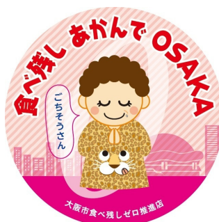
[그림 1] ‘먹다 남기는 것 금지 OSAKA’ 스티커