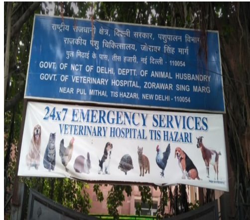
[사진 2] 24시간 동물 진료소 안내문

https://india.mongabay.com/2019/01/delhis-first-animal-welfare-policy-focuses-on-health-rehabilitation-and-awareness/