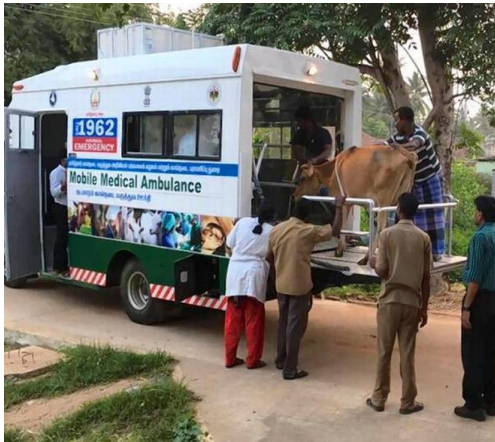
[사진 1] 동물 전용 구급차 모습