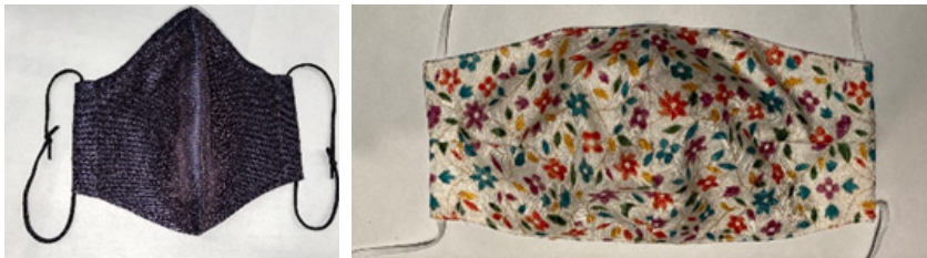
[사진 2] 전통기술을 이용한 ‘아트마스크’