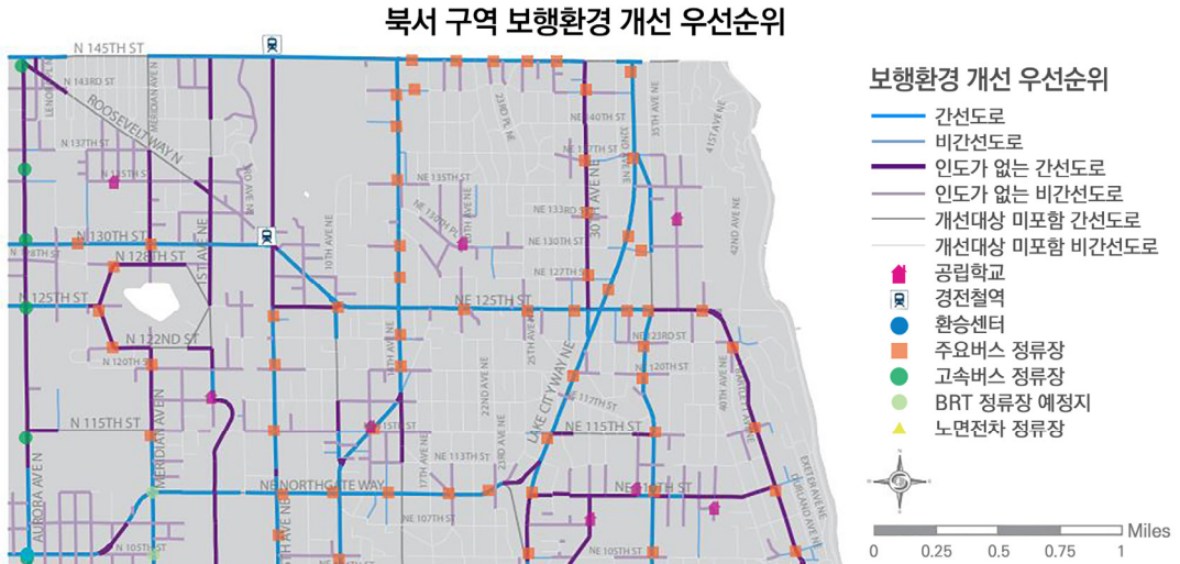
[그림 1] 시애틀 보행환경 개선 우선순위 설정 예시