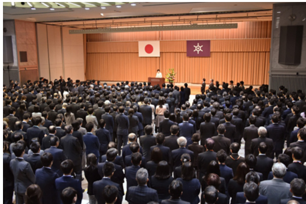
[그림 1] 도쿄도 고이케 도지사의 신년 직원인사 모습