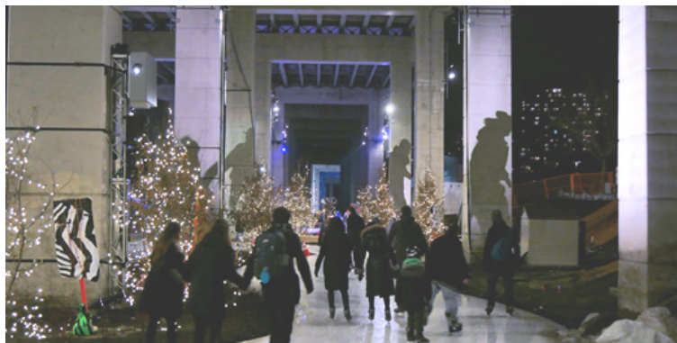
[그림 2] 스케이트를 타는 시민의 그림자를 활용한 공공시각예술

https://www.citylab.com/design/2018/02/in-toronto-a-likeable-space-arrives-underneath-a-loathed-expressway/553187