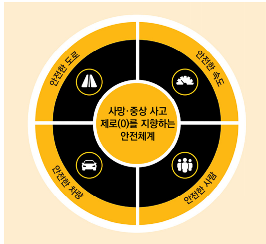
[그림 1] 안전체계 모형 개념