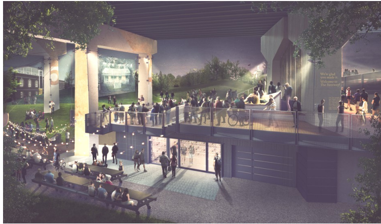
[그림 1] 고가도로 밑의 공간을 활용한 공공장소 개발 조감도