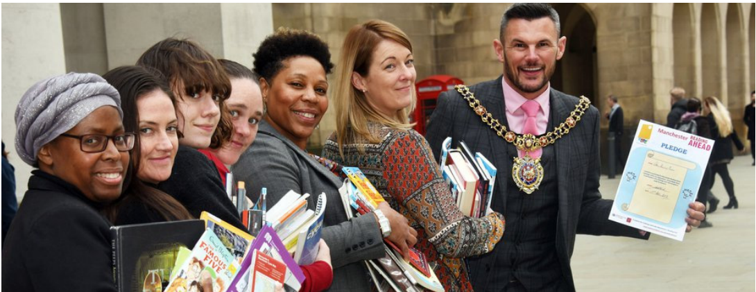
[그림 1] 시민과 인증서를 들고 독서장려 캠페인을 홍보하는 전 맨체스터시장 칼 오스틴 - 비한

http://www.manchester.gov.uk/news/article/7879/read_manchester_inspires_2000_residents_to_start_reading_ahead