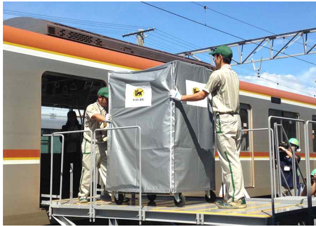
지하철을 이용한 택배 운송 실증시험