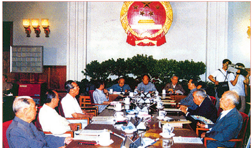
자료 중화인민공화국국토자원부(中華人民共和國國土資源部), 2006. 1986년 6월 25일, 제6차 전국 인민 대표 대회 상무 위원회 제16차 회의에서 '중화인민공화국 토지관리법'을 통과시켰다.